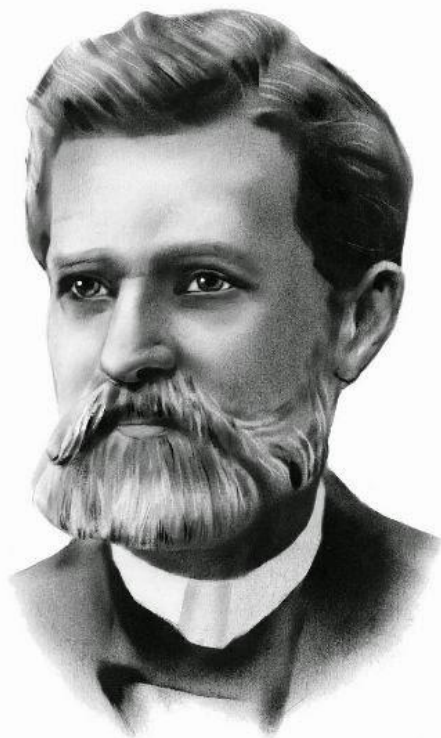
Іван Нечуй-Левицький (1838—1918)

ВЕЛИКИЙ МАЙСТЕР РЕАЛІСТИЧНОЇ ПРОЗИ ТА УКРАЇНСЬКОГО ПЕЙЗАЖУ